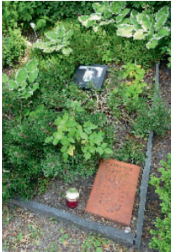
Ehrengrab des deutschstämmigen Fotografen Helmut Newton