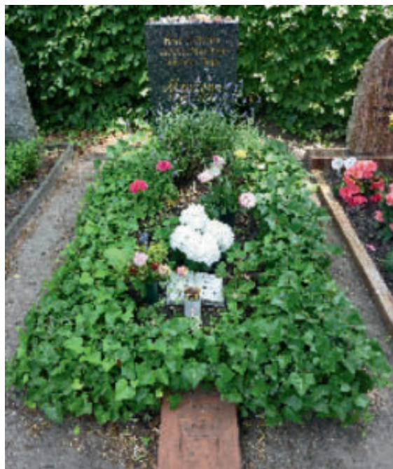
Ein Touristen-Magnet ist das Ehrengrab von Marlene Dietrich.