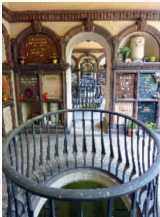
Blick ins Innere des Kolumbariums.